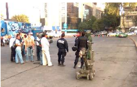
Policías federales y equipo antibombas participan en una filmación de Televisa en el Monumento a la revolución el pasado miércoles